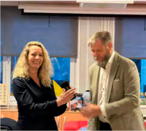
De nieuwe en scheidende voorzitter van de Commissie Loosduinen

hebben we met elkaar 100 jaar Commissie Loosduinen gevierd, waarbij we heel veel mooie festiviteiten hebben mogen organiseren: Montmartre, Dickens, Poëziefestival 'Dichter bij de Molen' en het Loosduins Schoolvoetbaltoernooi. Dit laatste toernooi staat inmiddels al voor het vierde jaar gepland. Wat ben ik trots op alle activiteiten die we samen met de andere Wijkberaden organiseren voor onze buurtbewoners. Het is allemaal vrijwilligerswerk, maar ik merk dat ik er enorm veel voldoening uthaal, vooral als het iets voor heel Loosduinen betreft.