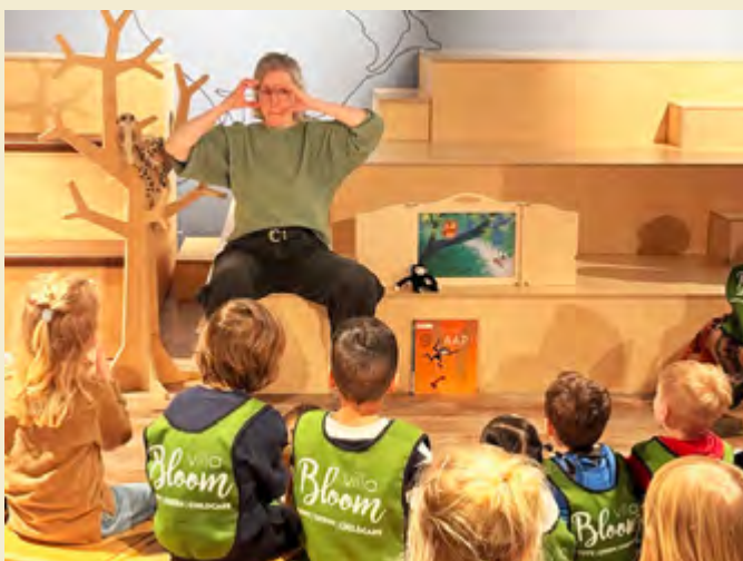
Aandachtig luisterende peuters tijdens het voorlezen

De toegang voor de activiteiten is altijd gratis.