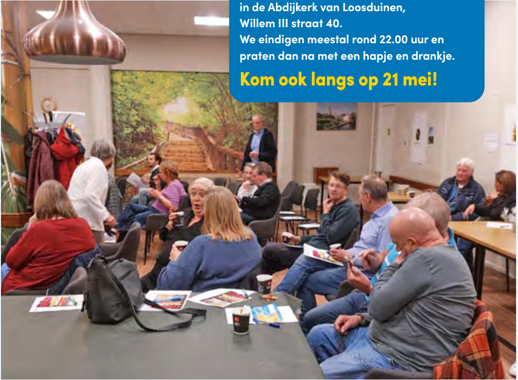
In gesprek over de Wijkagenda in De Henneberg